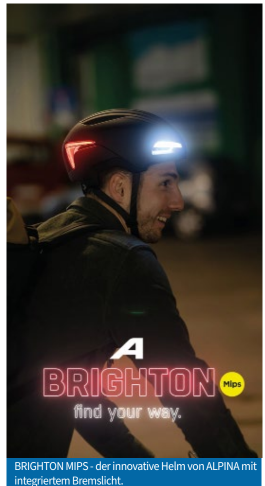
BRIGHTON MIPS - der innovative Helm von ALPINA mit integriertem Bremslicht.

Beim Kauf des ALPINA BRIGHTON MIPS erhalten Sie bei uns im Geschäft gratis einen Powerbank dazu! Nur solange Vorrat.