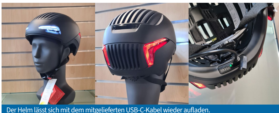
Der Helm lässt sich mit dem mitgelieferten USB-C-Kabel wieder aufladen.