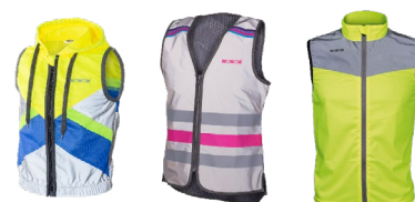
Mit den ansprechenden Leuchtwesten von Wowow sind Sie gut sichtbar.

Wer mit dunkler Kleidung draussen ist, ist erst in 25 Metern sichtbar und wird von Autofahrern kaum wahrgenommen. Wer eine auffällig gelbe oder stark reflektierende Jacke trägt, ist hier klar im Vorteil. Auch Leuchtwesten sind am Abend beliebt, wie beispielsweise die Leuchtwesten von Wowow: Cape Town Hoodie für Kinder, Lucy Jacket für Damen oder die Leuchtweste 20K Runner, welche sogar eine Beleuchtung auf der Rückseite integriert hat.