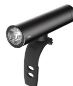
Der Scheinwerfer PWR Rider von Knog bietet mit 450 Lumen bereits eine gute Sicht.

Wer mit dem Fahrrad unterwegs ist, sollte bei Dunkelheit sowieso mit guter Beleuchtung ausgestattet sein, um auch selber den Weg vor sich ohne Probleme sehen zu können. Dabei gilt es, auf die Leistung des Lichts zu achten, welche meist mit Lumen angegeben wird. Wir empfehlen dabei, ein Fahrradlicht mit mindestens 400 Lumen auszuwählen, um im Dunkeln die Strasse sehen zu können. Je höher die Lumen-Angabe, desto heller die Beleuchtung.