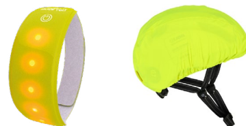
Das Lightband von Wowow und der Computer Helmüberzieher von AGU fallen auf.

Ein Leuchtband wie das Lightband von Wowow kann einfach am Arm oder am Bein angebracht werden, um mit gut sichtbaren LED-Lichtern auf sich aufmerksam zu machen. Auch ein auffälliger Helmüberzug hilft, dass man gesehen wird und schützt dabei sogar vor Regen.