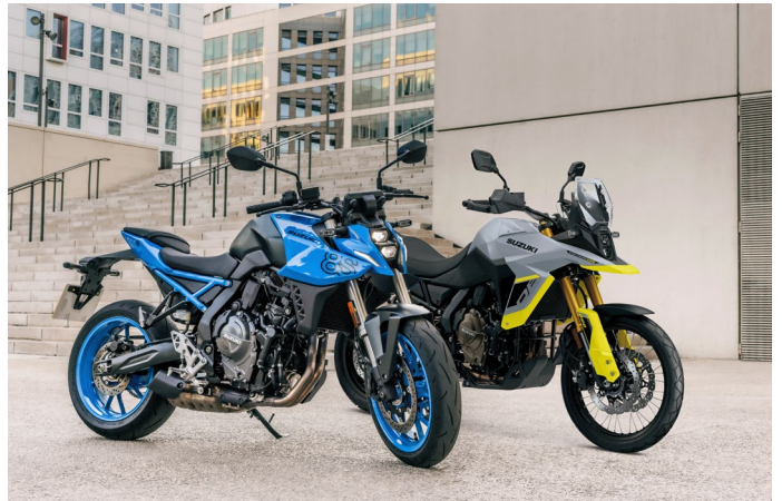
Die neuen Modelle der Mittelklassen begeisterten durchwegs.

Das grosse Highlight am Stand waren klar die beiden Top-Neuheiten GSX-8S und V-STROM 800DE , welche an diesem Wochenende ihre Schweizer Premiere feierten. Gleich vier Fahrzeuge waren am Start und von Anfang an bis ganz am Schluss konstant für Testfahrten ausgebucht. Die Resonanz der Test-Rider war durchwegs positiv bis begeistert. Rückmeldungen wie sehr handlich, agil, gute Sitzposition und einfach geil waren nicht selten.