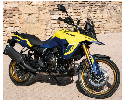
Die DL800 eröffnet die ganze Welt des Adventure-Tourings mit kraftvollem Motor.