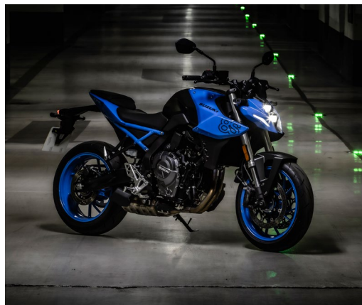
Unbändige Drehfreude und der agile Parallel-Twin-Motor zeichnen die GSX-8S aus.