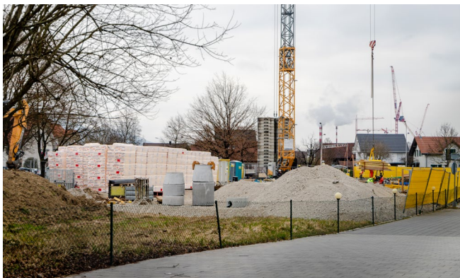
Die Bauarbeiten am neuen Standort sind in vollem Gange!