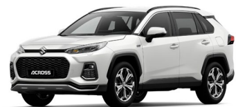
Suzuki Across mit Plug-In Hybrid