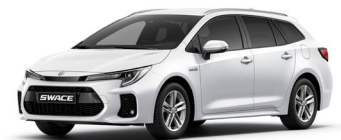
Suzuki Swace mit Vollhybrid