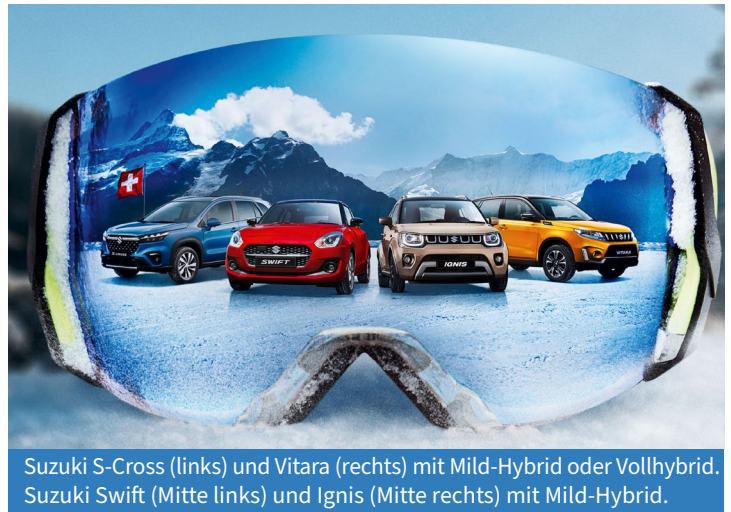
Suzuki S-Cross (links) und Vitara (rechts) mit Mild-Hybrid oder Vollhybrid. Suzuki Swift (Mitte links) und Ignis (Mitte rechts) mit Mild-Hybrid.

Bei der Plug-In Hybrid Technologie kommt die Ladestation zum Einsatz. Der Elektromotor ist die primäre Antriebsquelle, während der Benzinmotor die Batterie lädt und je nach Ladezustand, bei höheren Geschwindigkeiten und starkem Beschleunigen unterstützt. Mit dem System erlaubt der Suzuki Across eine rein elektrische Reichweite von 75 km. Der CO 2 -Ausstoss kann so sehr gering gehalten werden (beim Across auf 22 g/km). Die Batterie wird nicht nur über die Steckdose, sondern auch über den Benzinmotor geladen.